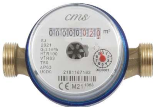
ACQUA FREDDA T 50 °C