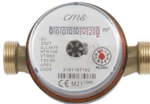
ACQUA CALDA T 30/90 °C